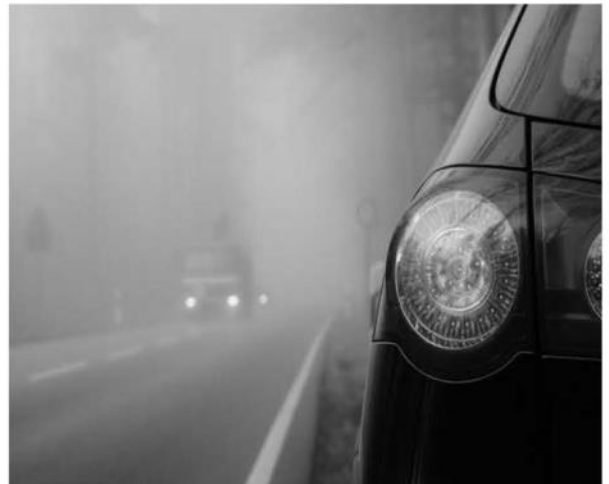
Vorsicht bei Nebel und nassen Fahrbahnen