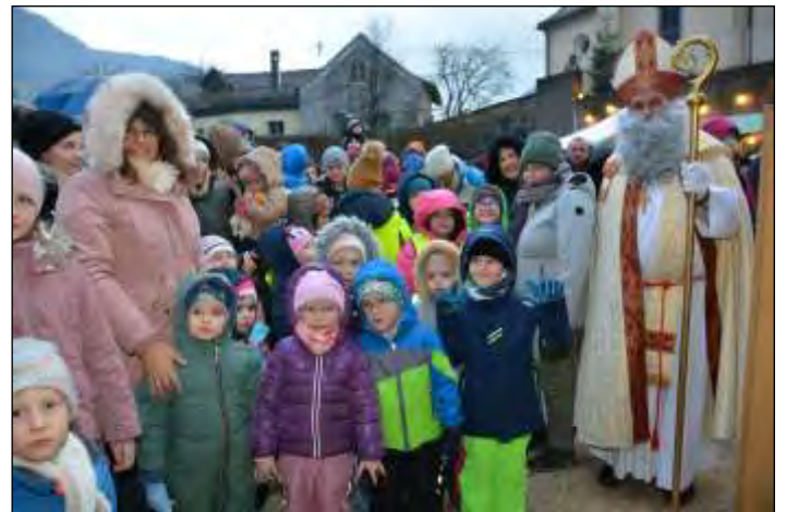
der „Nikolaus“ mit Kindern vom Kindergarten und der Volksschule St. Nikola