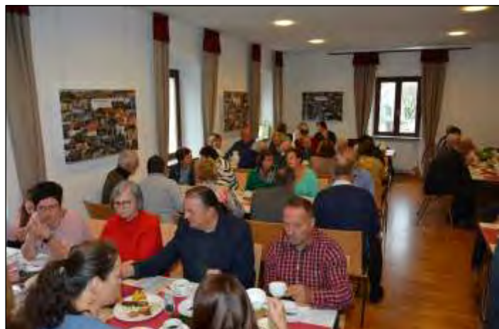
Blick in den vollbesetzten Parrsaal