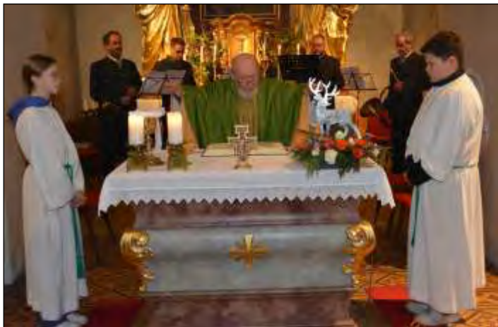
Die Jagdhornbläser „Hubertus“ aus Persenbeug gestalteten die Messe musikalisch.