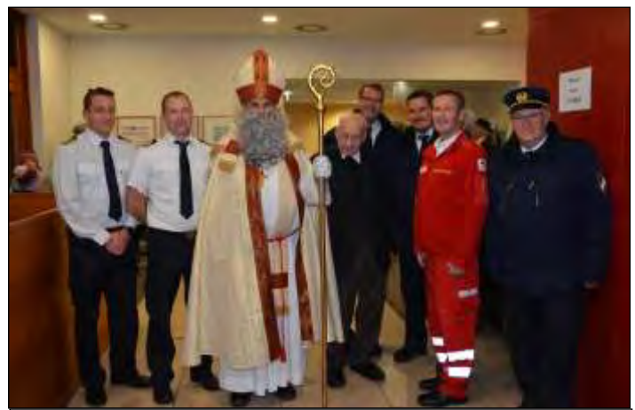
der „Nikolaus“ mit Ehrengästen im Foyer des Gemeindesaales