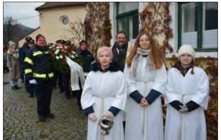
Aufstellung zum Festzug zur Donau