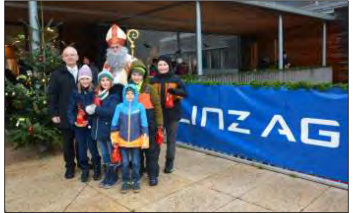
Unsere Sponsoren helfen die finanziellen Ausgaben etwas zu dämpfen.