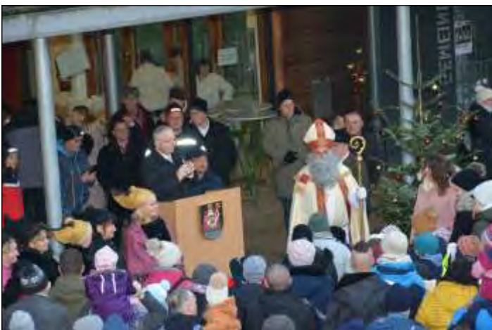
Bgm. Nikolaus Prinz bei der Begrüßung