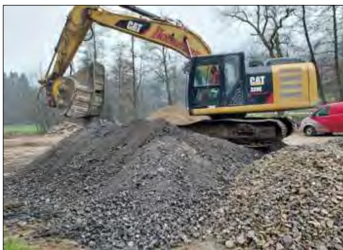
Der anfallende Asphalt wurde am Lagerplatz zerkleinert und für den Unterbau wieder verwendet.

Zur Finanzierung der mehr als € 200.000,— für diese Arbeiten gibt es Geld vom Katastrophenfonds, dem Land OÖ sowie der Gemeinde St. Nikola. Dank gilt auch den Mitarbeitern der ausführenden Firmen für ihre sehr wertvolle Arbeit sowie den Grundanrainern.