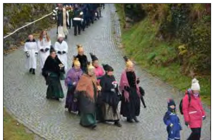
Die Damen der Goldhauben- und Kopftuchgruppe sind verlässliche Festteilnehmerinnen.