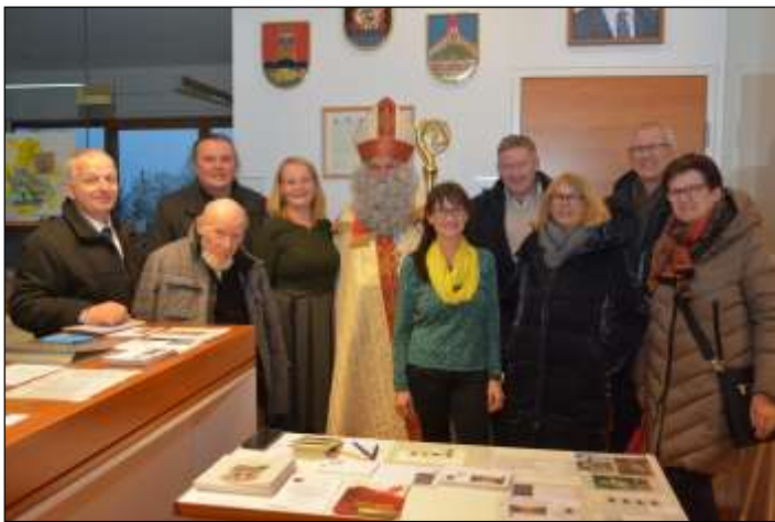
Sonderbelegverkauf am Gemeindeamt hier mit dem Besuch aus Schwoich