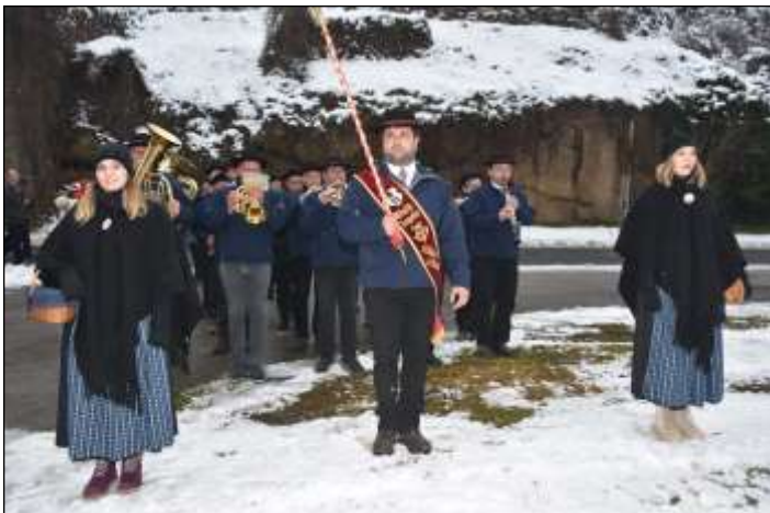
Musikkapelle St. Nikola