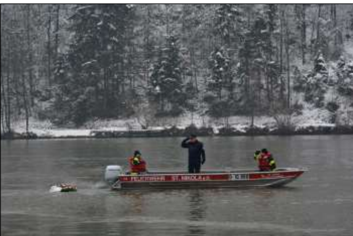
Der Kranz wird den Fluten der Donau übergeben.