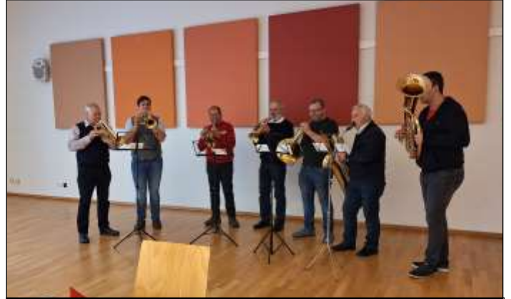
für die musikalische Umrahmung sorgte eine Bläsergruppe