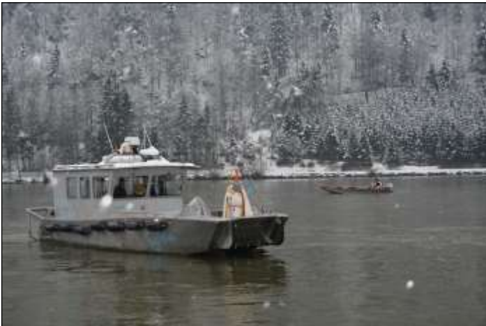
Der Nikolaus kommt mit dem Schiff der via donau „Halbe Meile“.