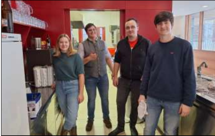
die Jungmusiker bei der Schank im Einsatz

Produktionsqualität. Danke der Abordnung der Musikkapelle für ihre musikalische Umrahmung und vor allem allen Helferinnen und Helfern.