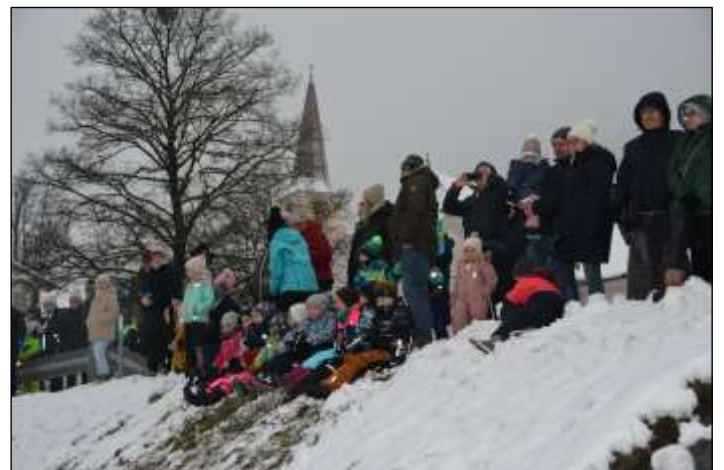
Die Kinder warten auf den Nikolaus.