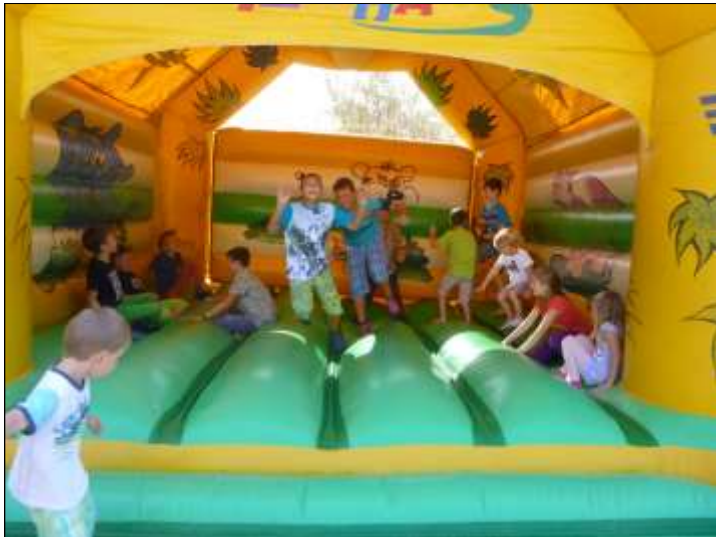
In der Hüpfburg herrschte gute Stimmung bei den Kindern.

hartsberger und seiner Familie für das Areal sowie allen Helferinnen und Helfern der ÖVP-Ortsgruppe St. Nikola.