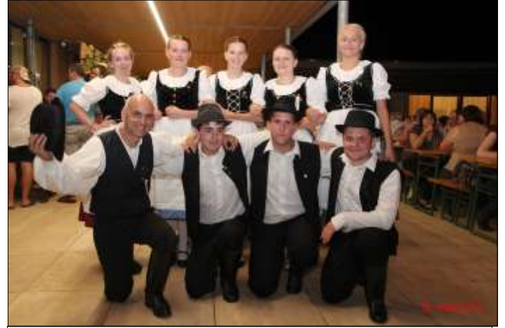
Am Samstag Abend zeigte die Volkstanzgruppe unserer Partnergemeinde Dunaszentmiklos ihre schwungvollen Volkstänze.