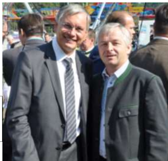
Das Foto zeigt Bundesminister Alois Stöger mit Bgm. Nikolaus Prinz beim Strudengauer Volksfest.

Eine Realisierung von Schutzmaßnahmen ist nur mit Hilfe von Bund und Land möglich. Von einem Treffen mit dem zuständigen Minister erwarte ich nachfolgend rasche Entscheidungen. Damit wir als Gemeindeverantwortliche, vor allem aber die betroffenen Menschen in Hirschenau Klarheit haben, was möglich ist und was nicht möglich ist.