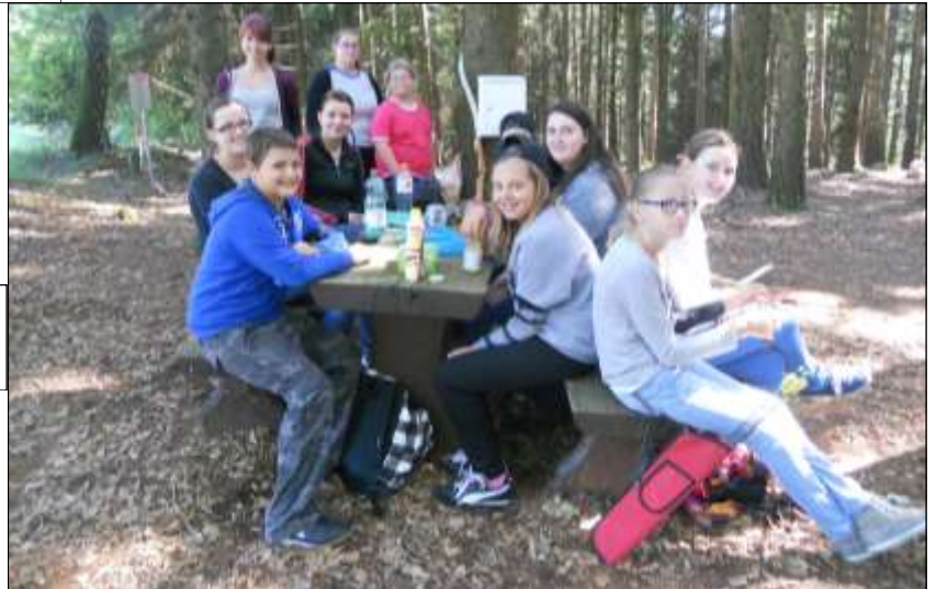
Rast an einem der idyllischen Plätzchen in Windhaag/Perg