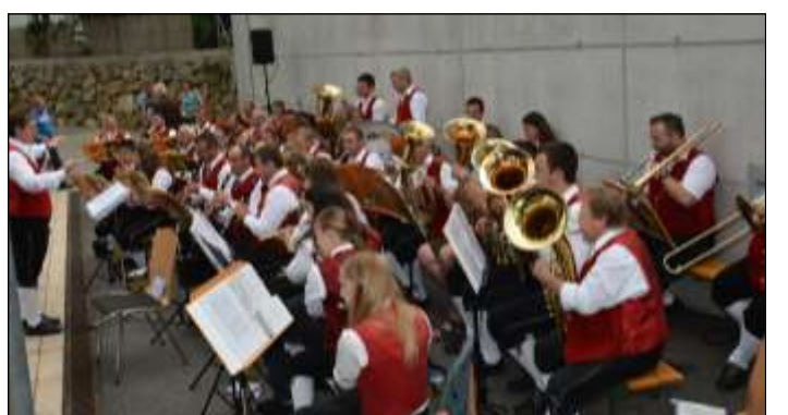
Die Trachtenmusikkapelle St. Nikola spielte beim Fröhlichschoppen am Sonntag.