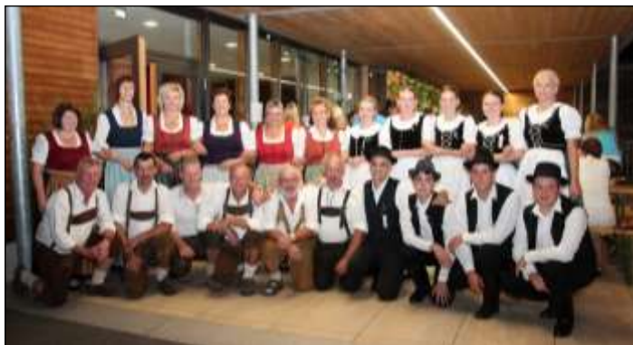
Auch die Volkstanzgruppe St. Nikola verschönerte den Abend mit ihren Tänzen. Hier am Foto die Volkstanzgruppe St. Nikola mit den ungarischen Volkstänzern.