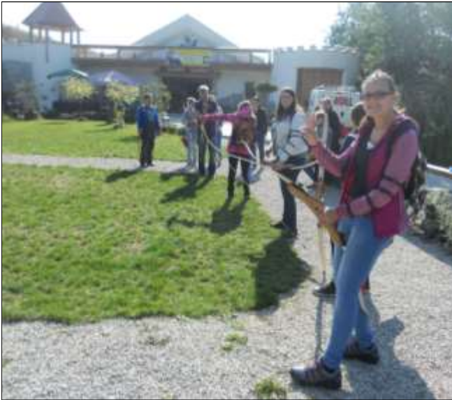
Die Teilnehmer an der Ferienaktion „Bogenschießen“ bekommen div. Einschulungen.