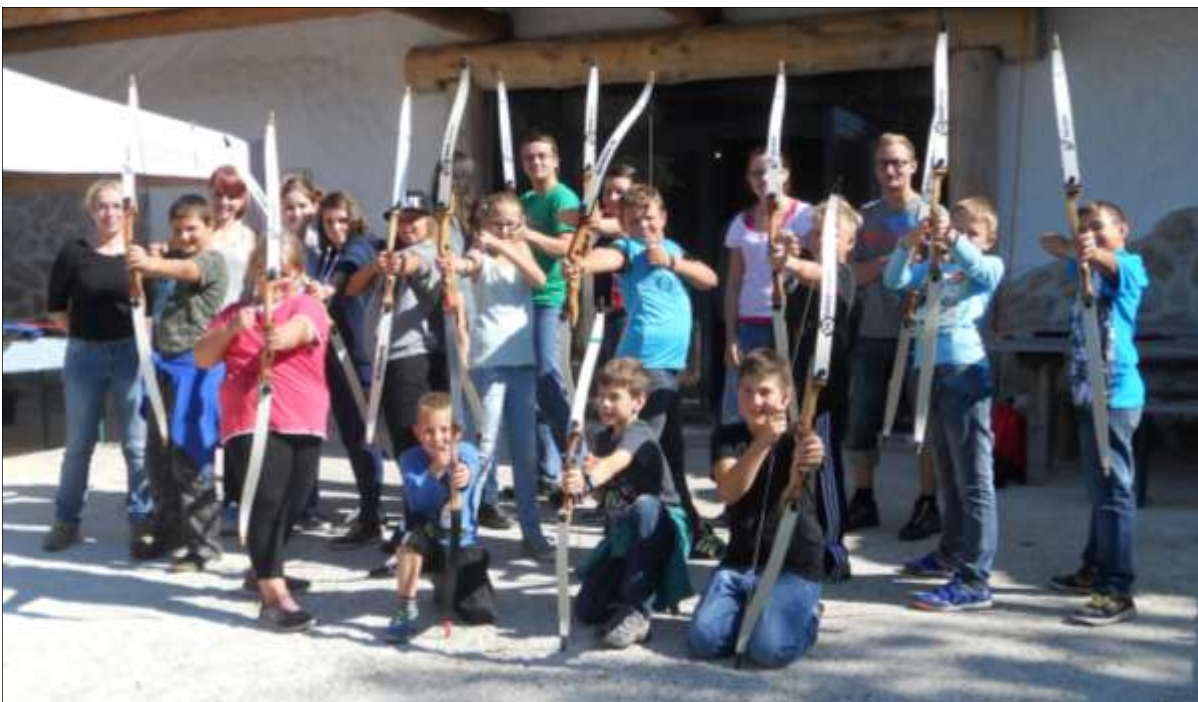
die JVP-Betreuer/innen mit den teilnehmenden Kids