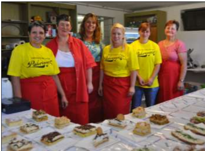
Die ÖVP-Frauen sorgten für das leibliche Wohl. Es gab Kaffee und köstliche Mehlspeisen sowie verschiedenste Brote.