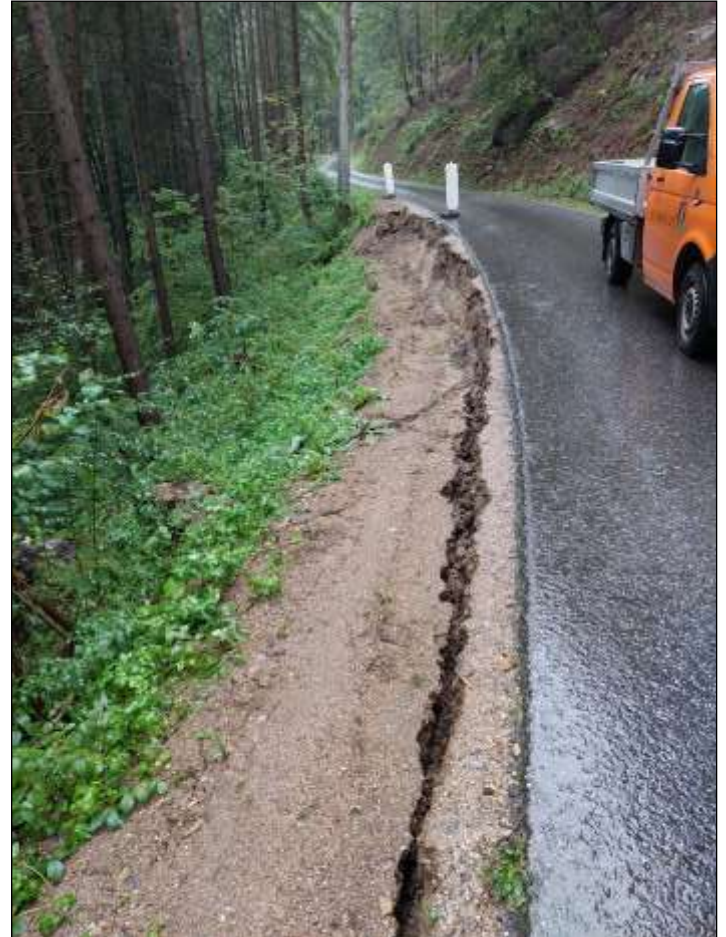
Das Bankett wurde an drei verschiedenen Stellen kaputt.