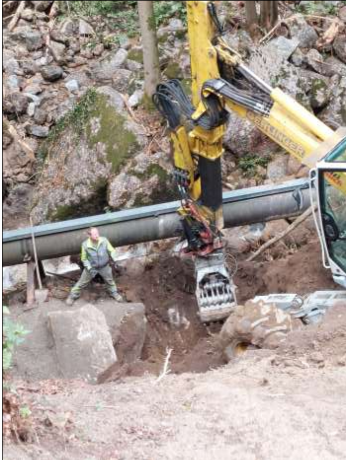
Direkt neben der Rohrleitungen wurde mit der Steinschichtung begonnen.