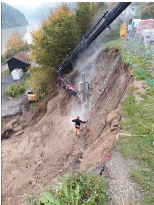
Bis zu 12 Meter wurden die Ankerstäbe in den Hang gebohrt.

hoben werden. Danke den Anrainern für ihr Verständnis in dieser Phase. Ein Danke gilt aber auch den ÖBB und der Straßenmeisterei Grein für die raschen Entscheidungen und allen Mitarbeitern der ausführenden Firmen.