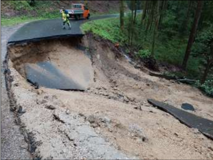
Auf rund 35 m ist die Fahrbahn komplett weg.

Beginn im Einsatz. Der Baufortschritt ist auch von der Witterung abhängig. Ziel ist natürlich noch im heurigen Jahr die Befahrbarkeit zu erreichen, es wird jedenfalls intensiv daran gearbeitet. Ein Danke allen für ihren Einsatz.