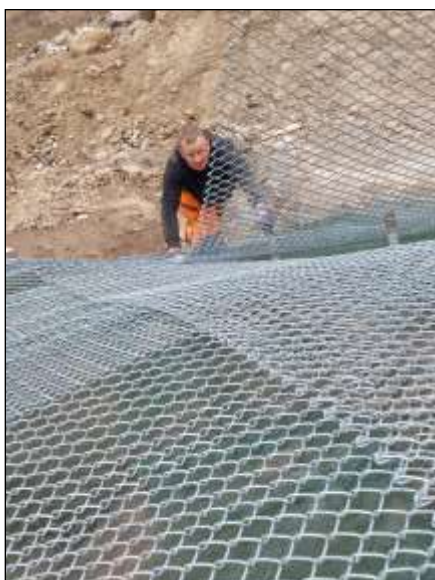
Das Anbringen der Netze war eine der letzten Arbeiten.