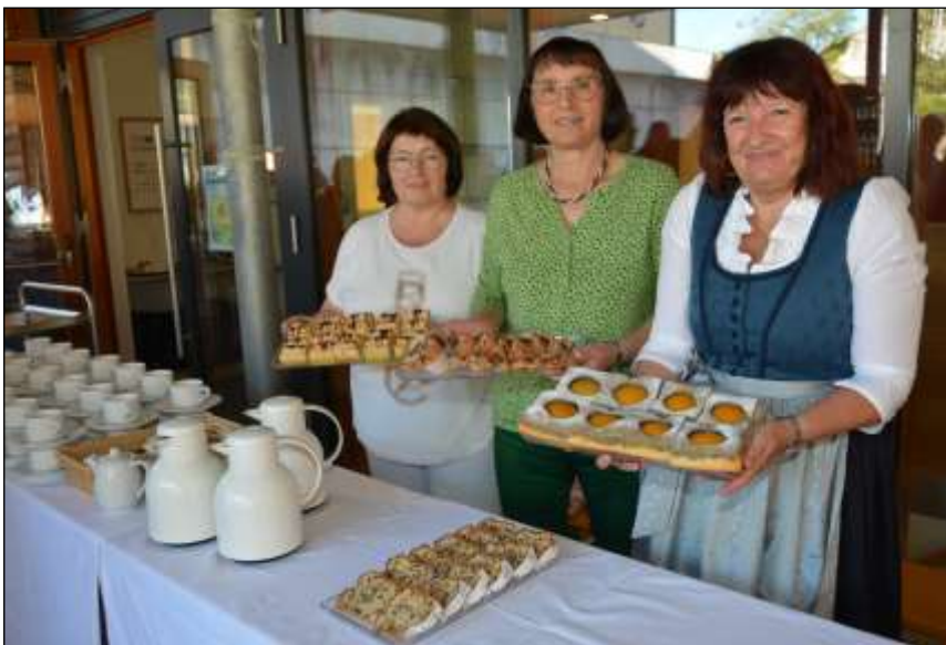
Danke für die kulinarische Versorgung