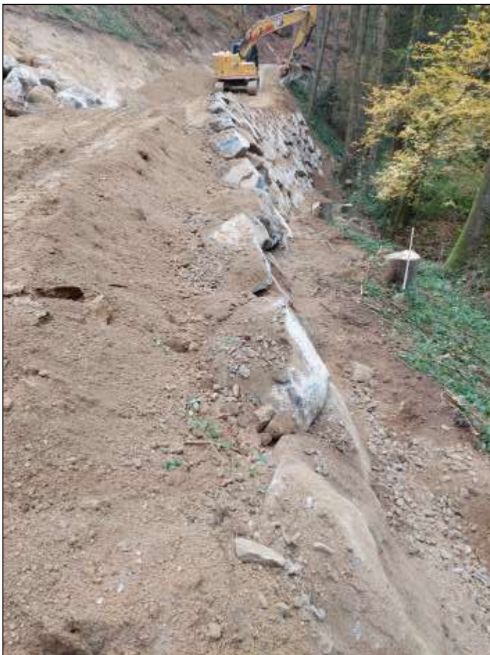
Blick auf die Steinschichtungsarbeiten