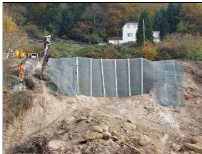
Blick auf die Netzgitterverankerung