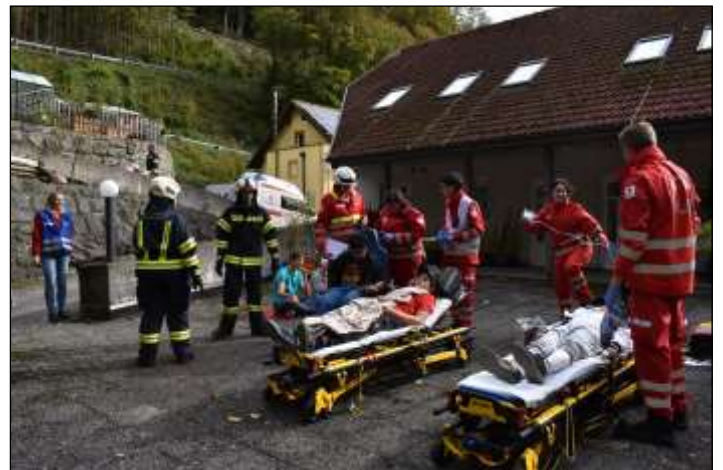
Das Rote Kreuz unterstützte bei der Versorgung der geborgenen Personen.