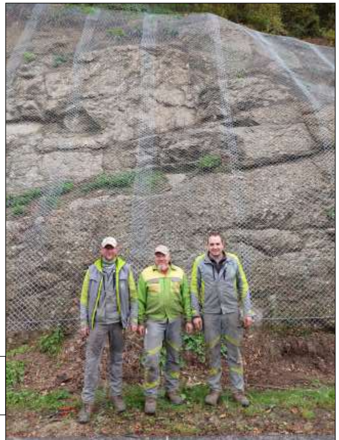
Mitarbeiter der WLV vor einer fertigen Netzsicherung neben der Sarming-Landesstraße

Im Auftrag der WLV erfolgten im September und Oktober Felssicherungsarbeiten entlang der Sarming-Landesstraße nach der ersten Serpentine (Zufahrt Berger). Mit dem Anbringen der Netze an drei verschiedenen Stellen wird die Steinschlaggefahr sicher wesentlich reduziert. In beiden Fällen gilt den Auftraggebern und den ausführenden Mitarbeitern Dank für ihr Engagement.