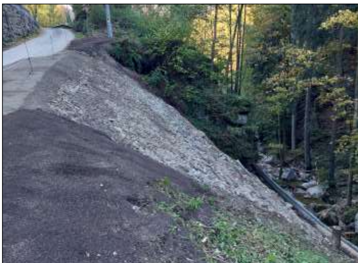
Blick auf die fertige Arbeit