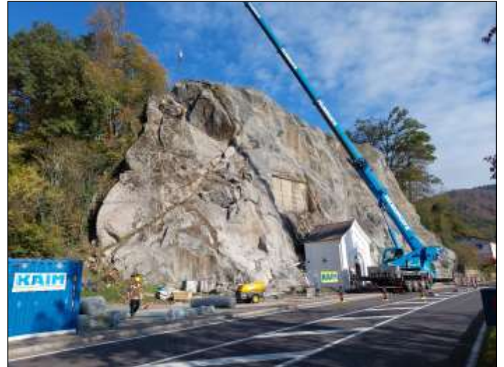
Fotos vom Montieren der Netze

Im Auftrag der WLV erfolgten im September und Oktober Felssicherungsarbeiten entlang der Sarming-Landesstraße nach der ersten Serpentine (Zufahrt Berger). Mit dem Anbringen der Netze an drei verschiedenen Stellen wird die Steinschlaggefahr sicher wesentlich reduziert. In beiden Fällen gilt den Auftraggebern und den ausführenden Mitarbeitern Dank für ihr Engagement.