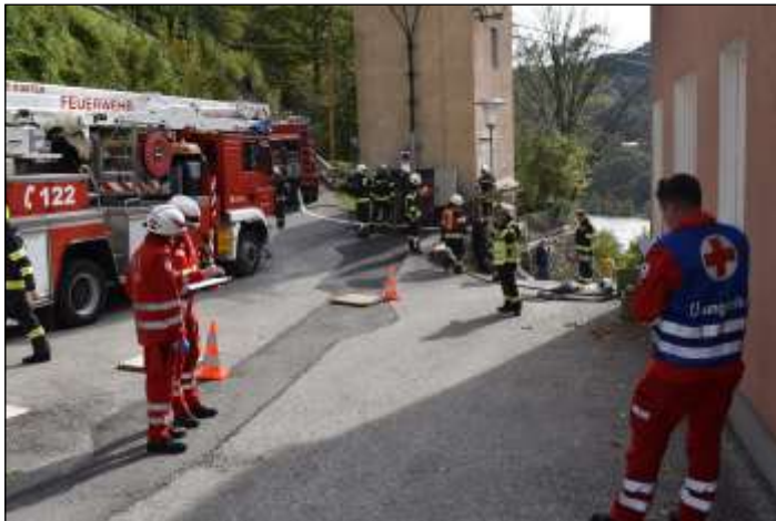
Blick auf den einzigen, einigermaßen ebenen Platz beim Wohnhaus Sarmingstein Nr. 24

gab es die gemeinsame Analyse des Übungsablaufes. Den Abschluss der Übung bildete die gemeinsame Jause. Dank gilt neben den teilnehmenden Feuerwehrleuten auch Haus-eigentümerin Julia Taubinger für die Unterstützung.