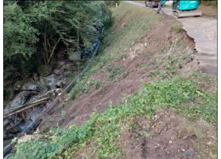
Vor Beginn der Arbeiten neben der Rohrleitung mussten einige Bäume gefällt werden.