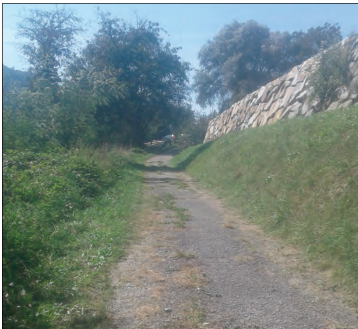
Blick auf den schlechten Zustand des öffentlichen Weges „Vienna Richtung Danzer“