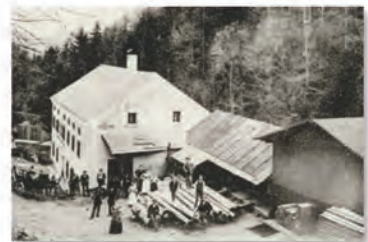
Haagsäge bei der Steinmühle

Gegen einen Beitrag von 30,00 kann die Karte beim Historischen Verein Sarmingstein bestellt werden.