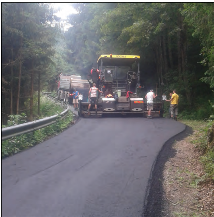
Das Foto zeigt die Arbeit mit dem Asphaltfertiger am Güterweg Achleiten

Ausgabe. Etwas mehr als 100 Laufmeter des öffentlichen Weges von der „Vienna“ Richtung „Hotel zur Post“ werden saniert. Die Vorarbeiten erfolgten ebenfalls in der dritten Septemberwoche. Der zweite Teil des sehr desolaten Weges soll nach Erneuerung der Wasserleitung in den nächsten Jahren saniert werden.