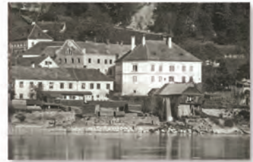
Die letzte Säge am Donaustrand

Die Karte ist ein einzigartiges Dokument über eine Zeit, in der täglich noch 40 Fuhrwerke Holz zum Weitertransport auf der Donau brachten.