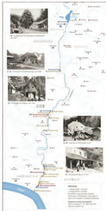
Unterer Ausschnitt der historischen Karte

So finden sich etwa Aufnahmen der Bergschmiede um 1910 und der unbekanntenen Haagsäge bei der Steinmühle von 1903.