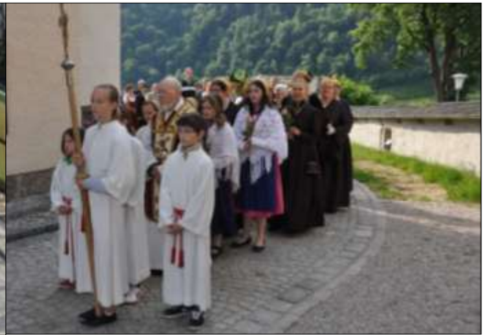
Die Musikkapelle begleitete die Jubelpaare genauso wie die Goldhaubenfrauen.