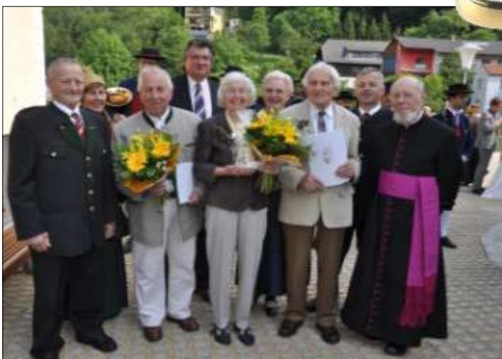
Der Seniorenbund St. Nikola gratulierte seinen Mitgliedern zum seltenen Fest der diamantenen Hochzeit, also 60 Jahre gemeinsamer Lebensweg.