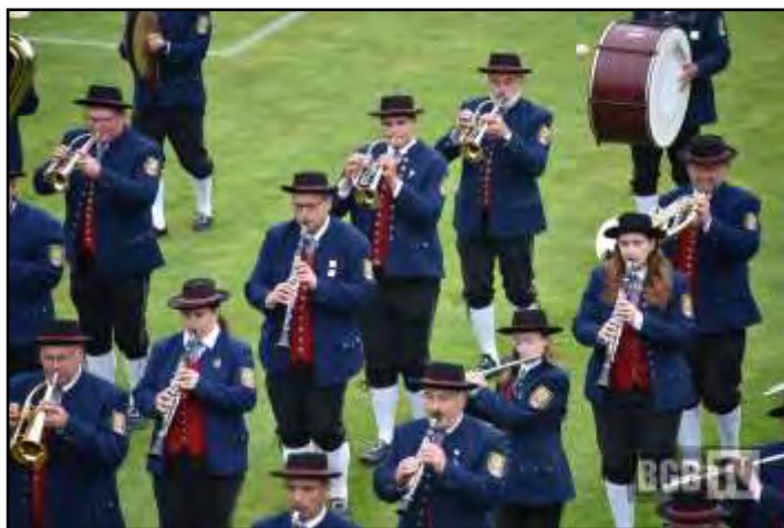
volle Konzentration bei der Marschwertung