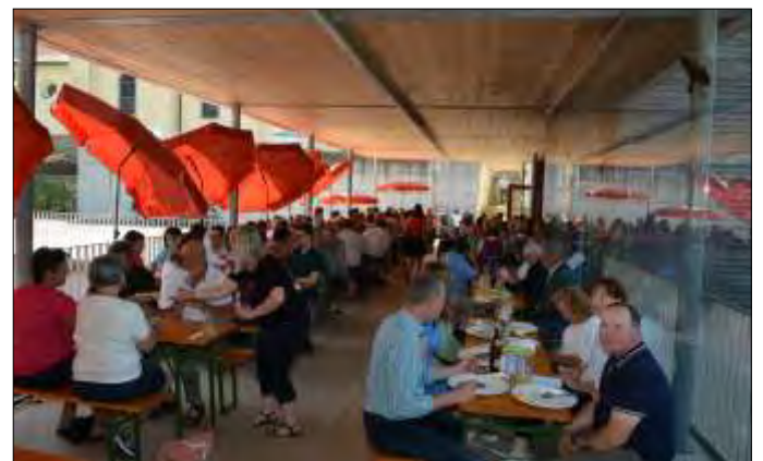
vor dem Gemeindesaal