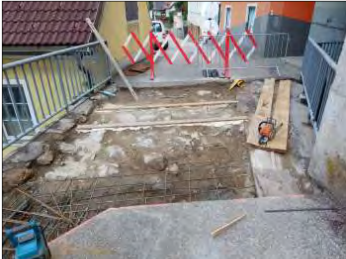
Das Foto zeigt Vorbereitungsarbeiten, bevor das erste Mal betoniert werden konnte.