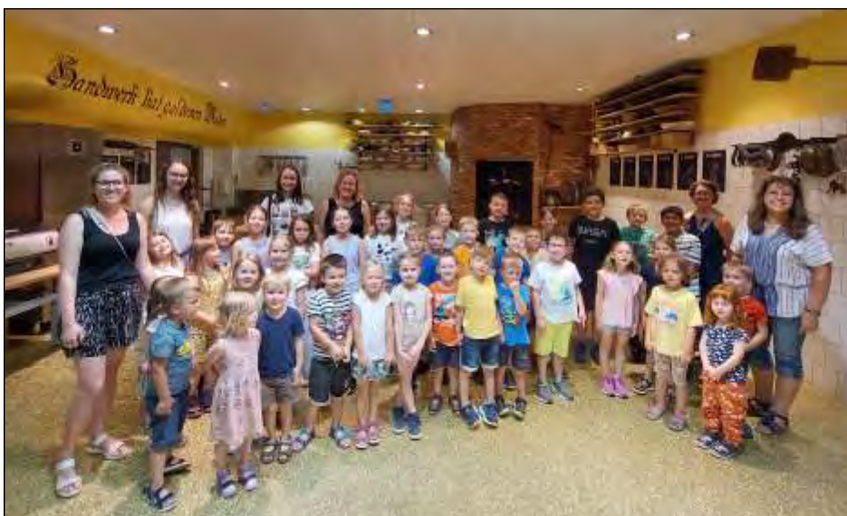
das Gruppenfoto der Kindergarten- und Volksschulkinder mit ihren Betreuerinnen im Haubiversum

Besonders stolz waren die Kinder über die selbstgebackenen Weckerl, die sie mit nachhause nehmen durften.