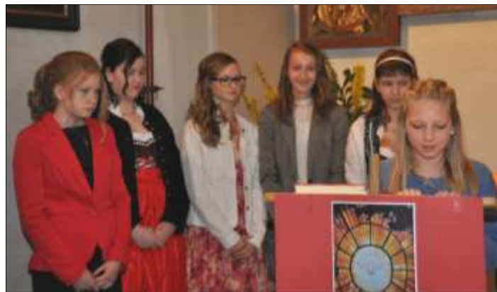
Die Firmlinge wurden aktiv in die Gestaltung des Festgottesdienstes eingebunden.