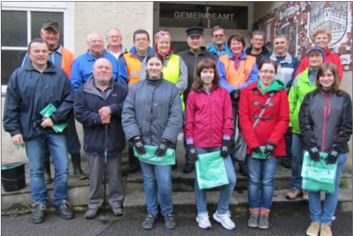
Gruppenfoto vor dem Start beim alten Gemeindezentrum