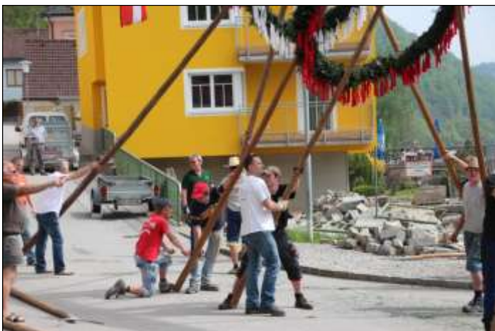
Das Aufstellen erfordert Muskelkraft.