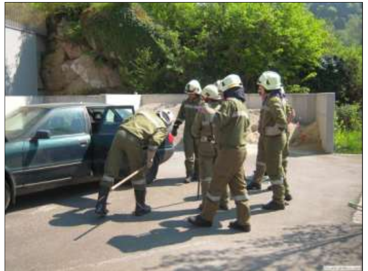
Das alte Auto der Familie Lumesberger wird genau „unter die Lupe“ genommen.