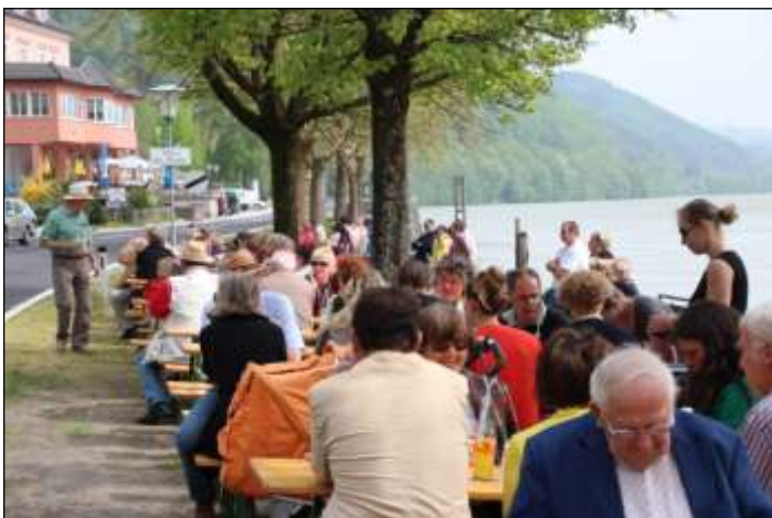
Guter Besuch und gute Stimmung in Sarmingstein