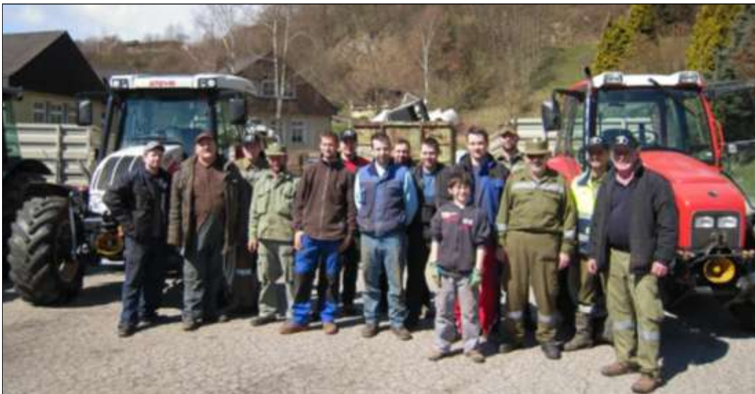
Gruppenfoto der Helfer bei der Alteisensammlung