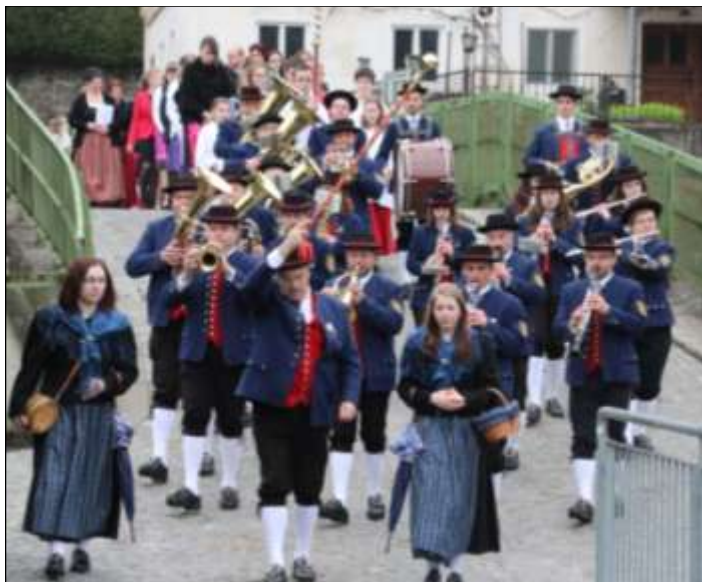
Der Festzug wurde von der Musikkapelle St. Nikola angeführt.

ke gilt allen, die zum gelungenen Fest beigetragen haben, wie z. B. der Musikkapelle, der Singgemeinschaft, den Pfarrgemeinderatsmitgliedern, dem Blumenschmuckteam usw.