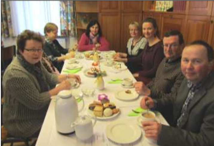
Die Gottesdienstbesucher ließen sich die Köstlichkeiten schmecken.