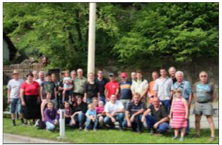
Alle Beteiligten in Sarmingstein