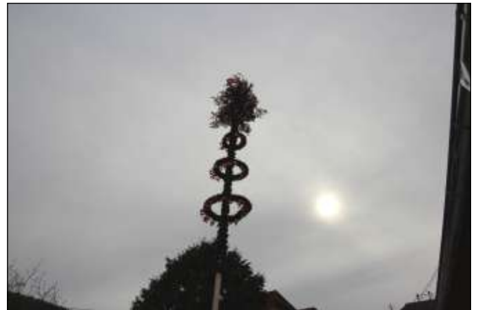
Der Strudener Maibaum streckt sich dem Himmel entgegen.