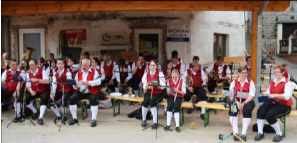
Die Musikkapelle nutzte das Vordach beim neuen Geschäft in Struden als Sonnenschutz.

Allen Helfer/innen Danke für ihr Engagement.