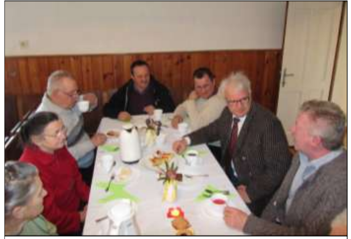
Ein gemütlicher Plausch beim Pfarrcafe.