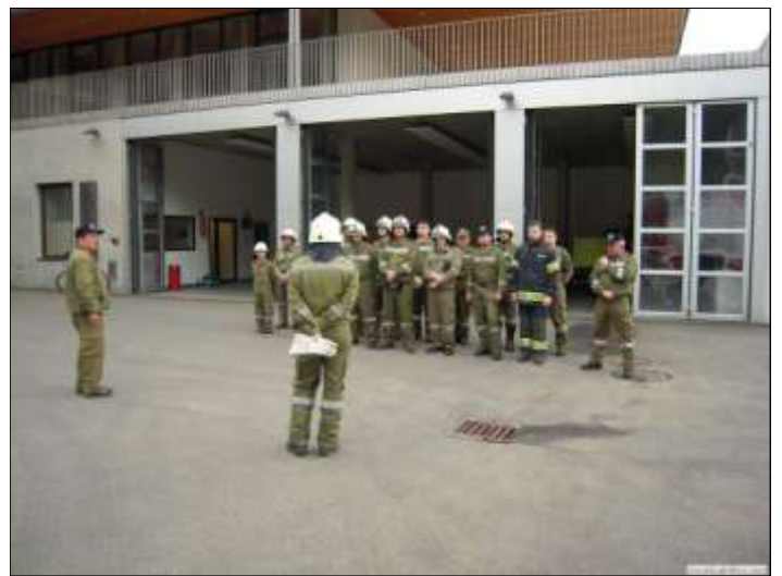
Alle Teilnehmer der Frühjahrsübung sind zur Abschlussbesprechung angetreten.