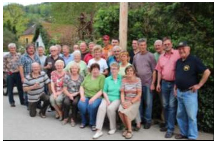
Die Strudener Helfer/innen.