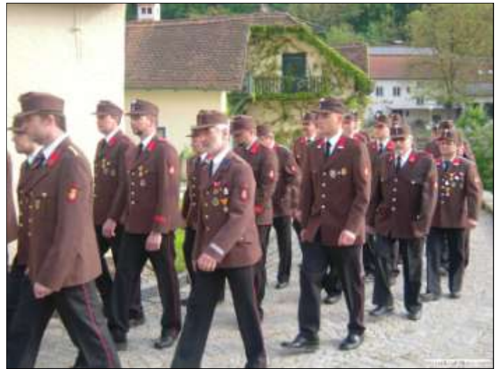
Einmarsch zur Florianimesse