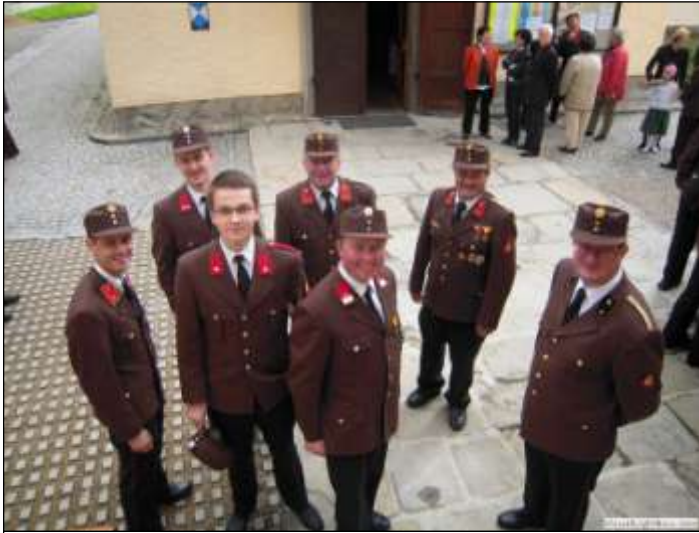
Vor dem Begegnungscafe blieb noch Zeit, um am Kirchenplatz der Musikkapelle zu lauschen.