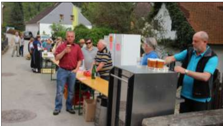
Zu einem Fest gehört auch die entsprechende „Versorgung“.