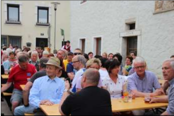
Viele Besucher waren in Struden dabei.