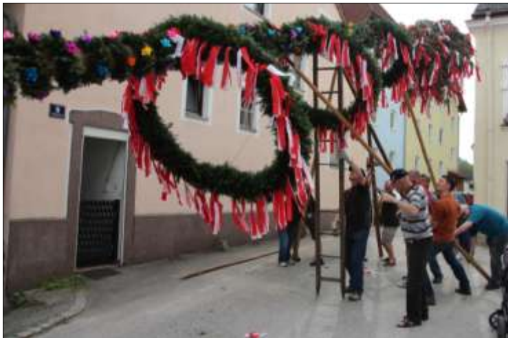
Friedrich Türscherl (r.) war in Struden für das Aufstellen verantwortlich.