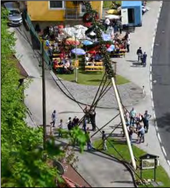
Vom Rundturm Sarmingstein aus hatte man den totalen Überblick