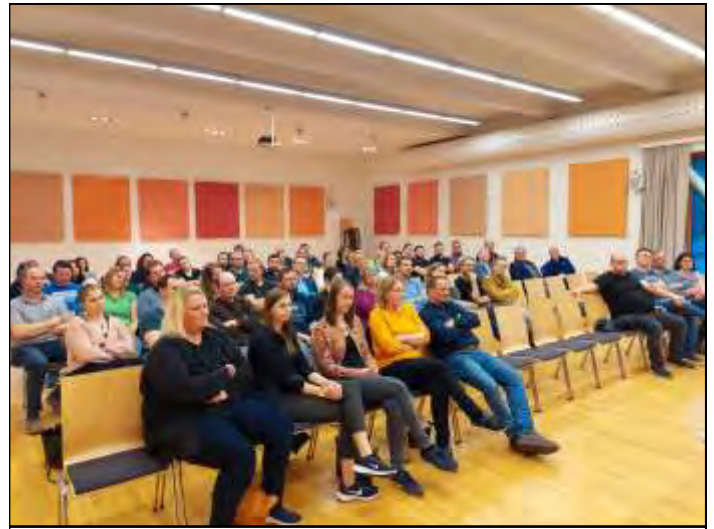
Blick in den gut besuchten Gemeindesaal