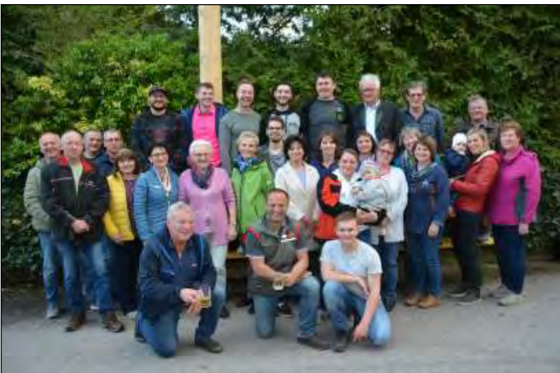
Gruppenfoto in Struden