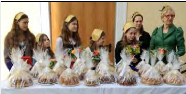
Der Erlös des Guglhupfverkaufes wird für den Ausflug mit den Goldmädchen verwendet.