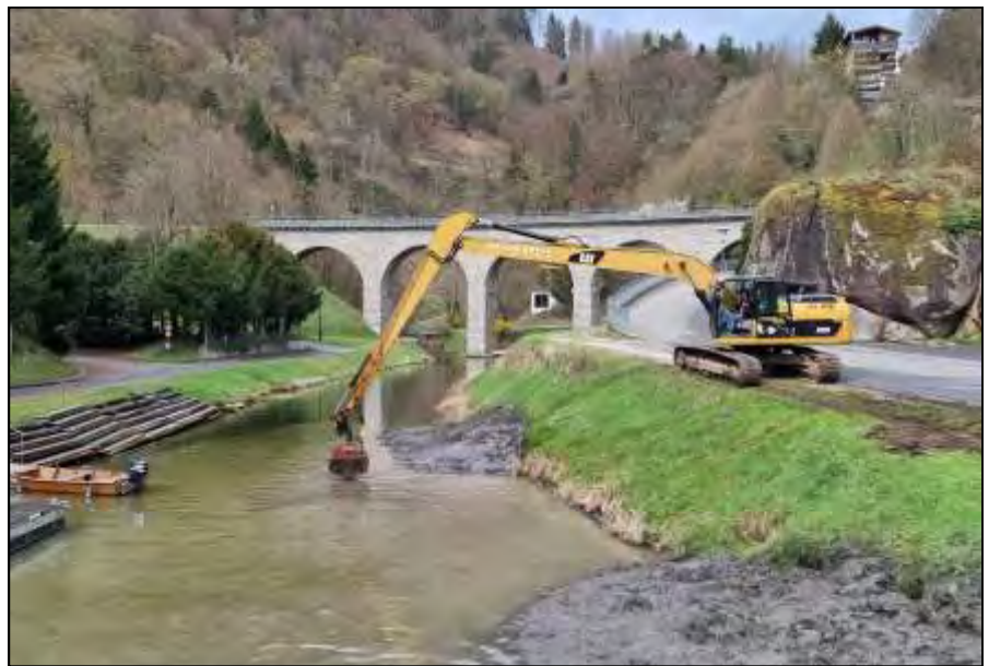
Das Foto zeigt Franz Pöchschröll bei der Arbeit mit dem großen Bagger.

Die Benutzer des Bootssteiges sowie des Zillenverheftplatzes sind froh, dass Herr Aigner von der Austrian Hydro Power die Baggerungen in Auftrag gab.