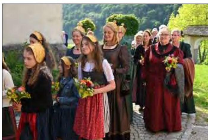
Dank an die Goldhaubengruppe