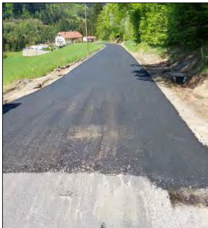
der Güterweg Achleiten nach Beendigung der Arbeiten am 9. Mai mit Blick Richtung Haus Kern