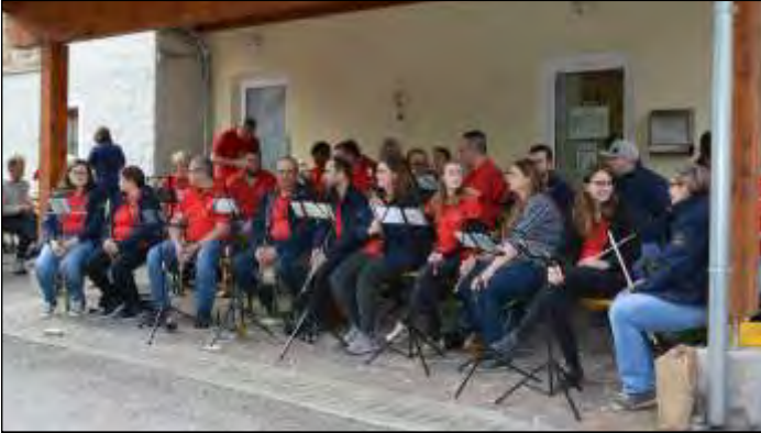
In Struden spielte eine große Abordnung der Musikkapelle auf.

Beide Termine waren sehr gut besucht und gelungene Veranstaltungen.