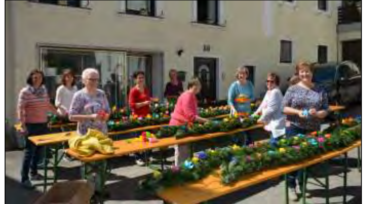
In der Vorbereitung braucht es viele fleißige Hände, wie hier am Foto in Struden.