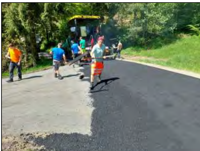
Das Foto zeigt die Arbeit am 9. Mai in der Nähe des Hauses der Familie Kern.

Dank gilt den Mitarbeitern des Wegeerhaltungsverbandes Unteres Mühlviertel sowie den ausführenden Firmen. Die Finanzierung erfolgte durch den Wegeerhaltungsverband unteres Mühlviertel, das Land OÖ sowie die Gemeinde St. Nikola.