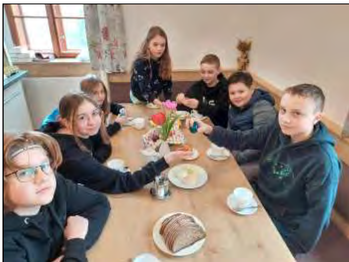
Die Ministranten nutzten die Gelegenheit zum Eier pecken.

des Härtegrades von Eierschalen. Danke an alle fleißigen Helfer/innen.