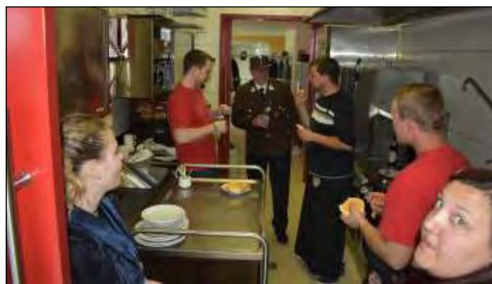
Nachdem alle Besucher/innen mit Würsteln gut versorgt waren, stärkt sich auch das Küchenteam.