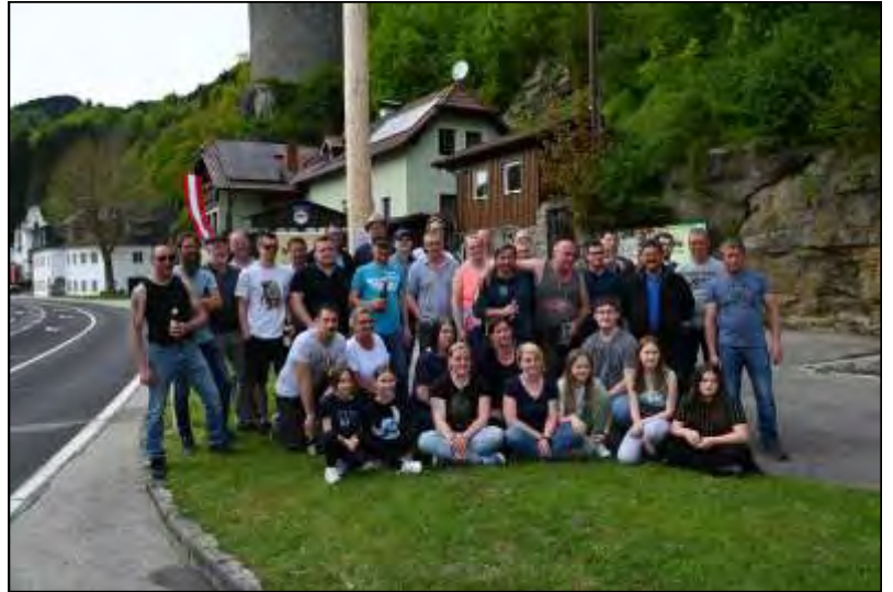
das Gruppenfoto der fleißigen Helfer in Sarmingstein