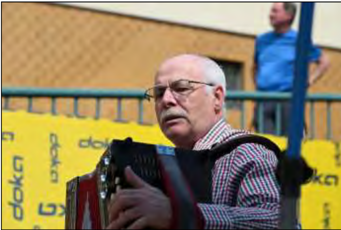
Dank an Leopold Schachinger für die musikalische Umrahmung