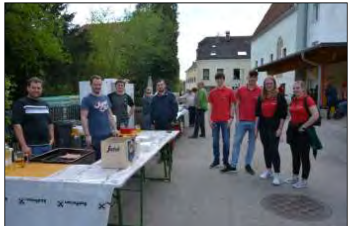
Gute Gästeverversorgung braucht viele fleißige Hände.