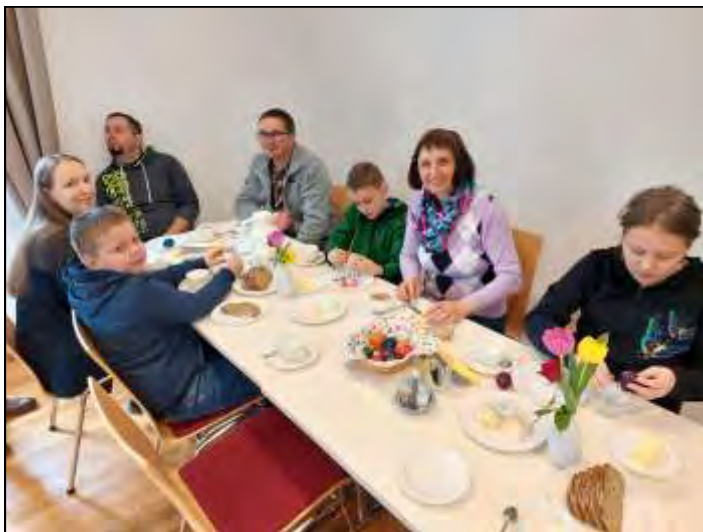
Die „Gerlingers“ genossen den Vormittag im Pfarrhof.