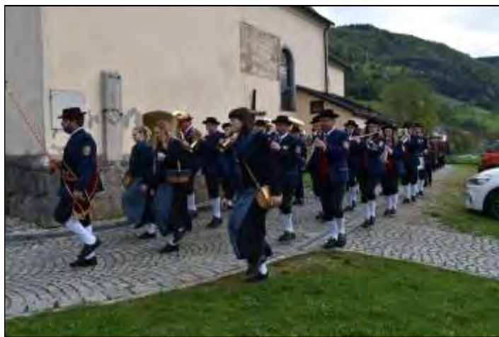
der Einzug angeführt von der Musikkapelle St. Nikola