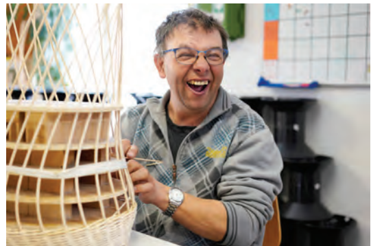
Bild 1: Die Lebenshilfe Oberösterreich wirbt ab Juni im Bezirk Perg mit einer Haustüraktion um Unterstützer.

Seit ihrer Gründung im Jahr 1969 engagiert sich die Lebenshilfe als eine der größten sozialen Organisationen in Oberösterreich für Menschen mit intellektueller Beeinträchtigung. Derzeit sind mehr als 1.500 Mitarbeiter*innen für knapp 2.000 Menschen mit intellektueller Beeinträchtigung im Einsatz. Das in Oberösterreich flächendeckende Angebot umfasst Frühförderstellen und Familienbegleitung, Kindergärten, Wohneinrichtungen, mobile Betreuung, Werkstätten und einen heilpädagogischen Hort.