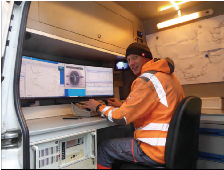
Alle Daten von der Kamerabefahrung wurden aufgezeichnet.