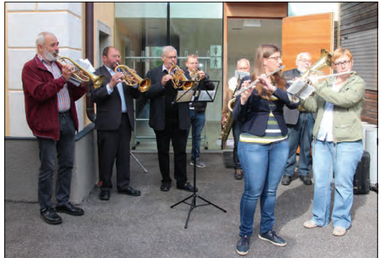
Eine Bläsergruppe begrüßte die „Erstkommuniongemeinschaft“.