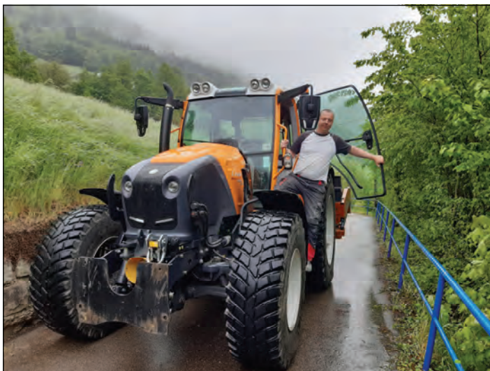
Peter Wunder entsorgte den Bauschutt (Fliesen, Kleber) im Altstoffsammelzentrum Grein.

angekauft werden und für die Technik waren Investitionen für die Umlaufpumpen notwendig. Damit wurden im heurigen Jahr seitens der Gemeinde bereits vor Saisonbeginn rund € 10.000,— für das Freibad ausgegeben.