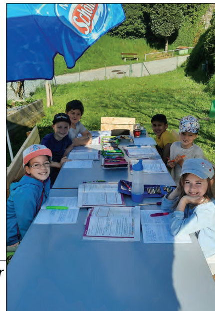
Die Volksschulkinder freuen sich über die neue Garnitur.