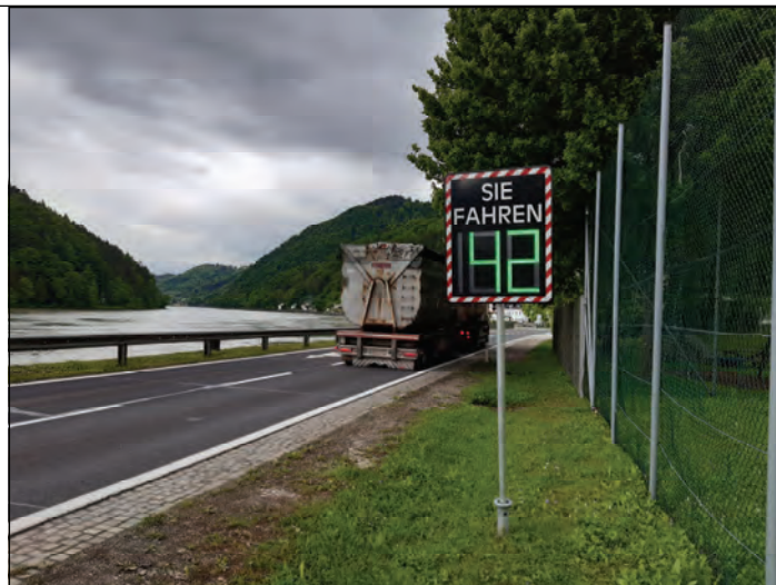
In Sarmingstein wurde die Fahrgeschwindigkeit angezeigt. Die Lenker auf diesen Fotos waren korrekt unterwegs.