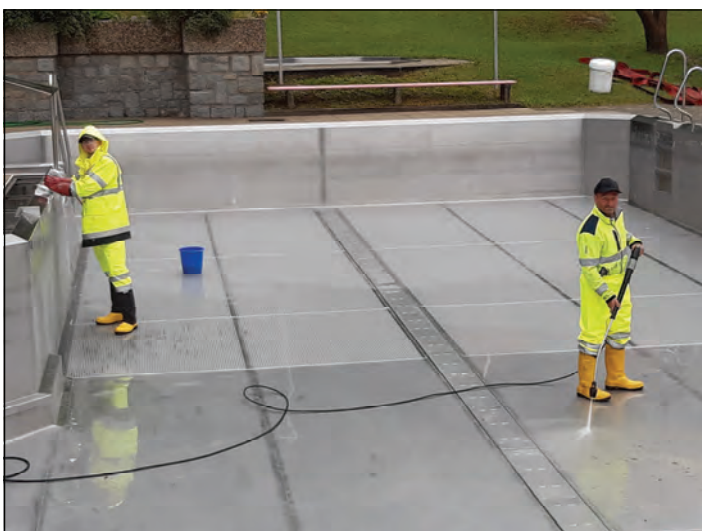
Markus Achleitner und Leopold Fasching bei der Beckenreinigung