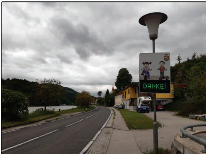
In St. Nikola zeigte das Wort „DANKE“, dass man langsamer als die erlaubte Höchstgeschwindigkeit fuhr.

bestätigen einerseits diese These und dass doch viele Kraftfahrzeuge mit etwas mehr als 50 Stundenkilometern in das Ortsgebiet einfahren. Diese Anzeigen sind batteriebetrieben und werden von Mitarbeitern des Landes OÖ wöchentlich gewartet.