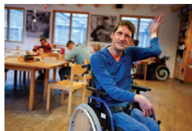
Bild 2: Ein finanzieller Beitrag unterstützt Menschen mit intellektueller Beeinträchtigung und ermöglicht ihnen die Chance auf ein selbstbestimmtes Leben.