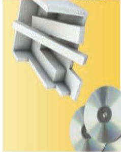
STYROPOR CDs, PVC