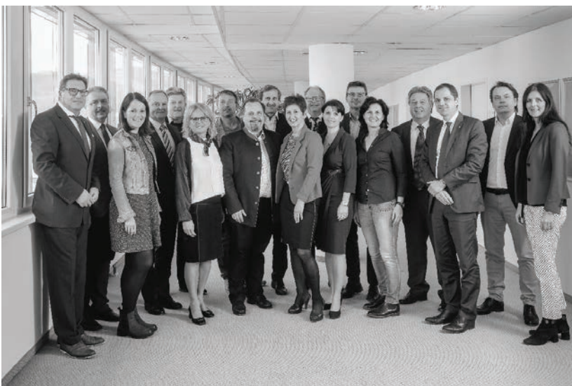
1. Aufsichtsratssitzung des Tourismusverbandes Donau Oberösterreich

Tourismusverband Donau Oberösterreich Lindengasse 9 4040 Linz info@donauregion.at