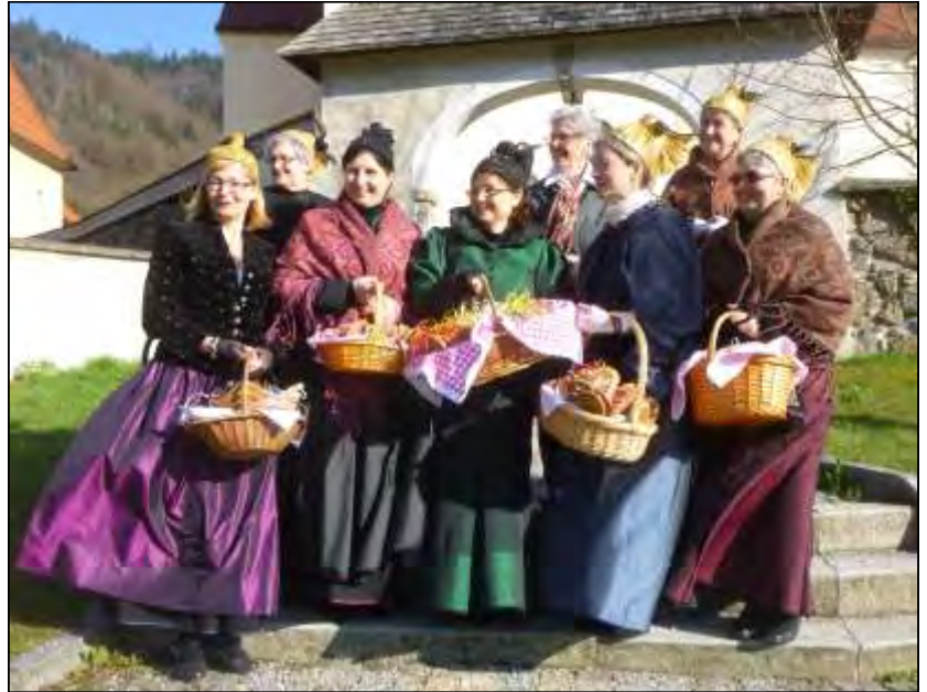
Goldhaubenfrauen vor dem Torbogen