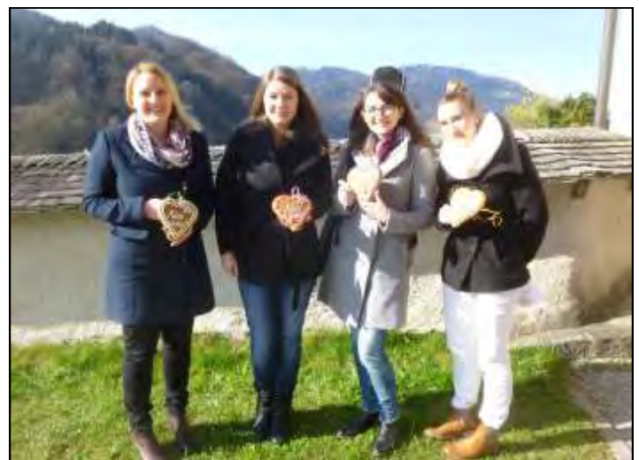
Die Lehrerinnen der Volksschule gestalteten gemeinsam mit den Volksschulkindern den Vorstellungsgottesdienst der Erstkommunionkinder.