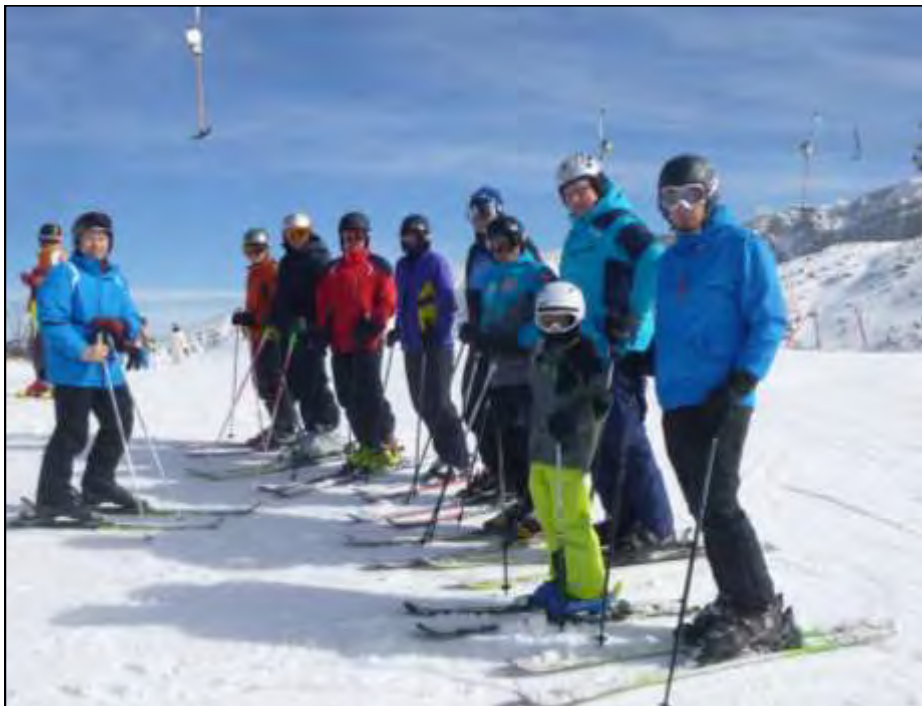
Gut geschützt mit Helm und Brille, dafür aber manchmal ein Rätselraten, wer sich dahinter verbirgt.