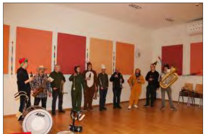
Die Abordnung der Musikkapelle sorgte für Live-Musik.