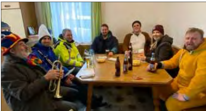
Auch eine Stärkung muss mal sein.