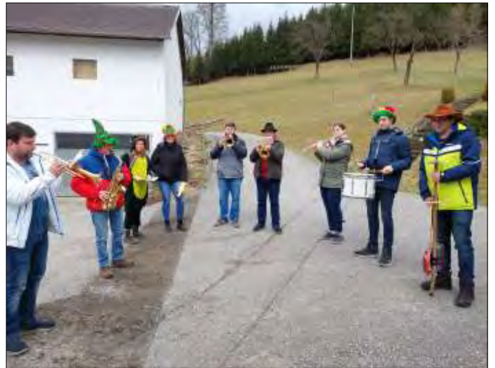
An 3 Tagen waren drei Gruppen in allen Ortschaften unterwegs.