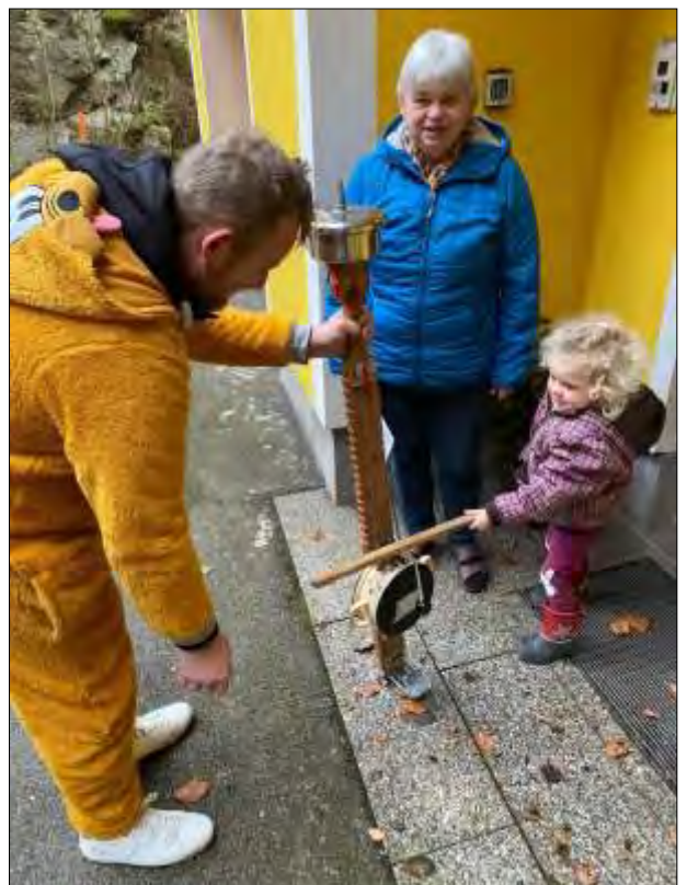
„Früh übt sich, wer ein Meister werden will“ wie hier das Foto bei Familie Winkler zeigt.