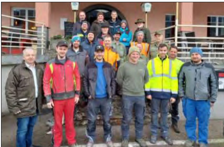
die Teilnehmer des Umweltaktionstages vor dem Gasthaus Ettlinger