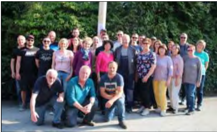
das Team in Struden