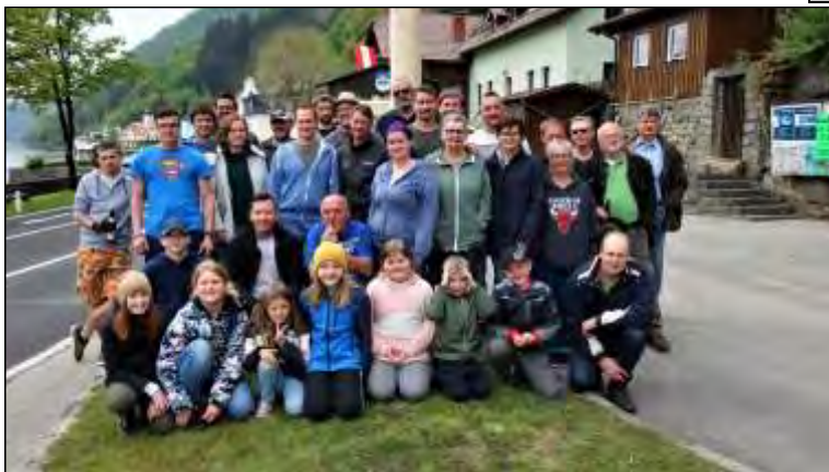
das Team in Sarmingstein