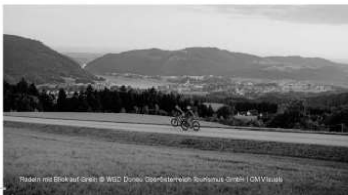
Radeln mit E-Bike auf Gneis