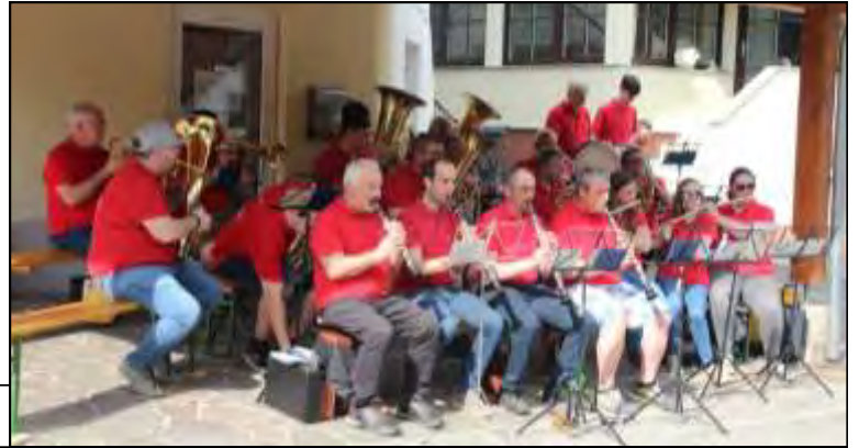
Die Musikkapelle spielte in Struden flott auf.