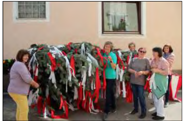
letzte Vorbereitungsarbeiten in Struden