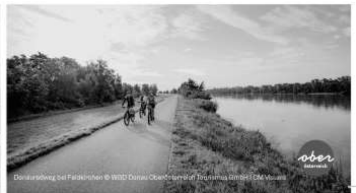
Donauradweg bei Faldkirchen