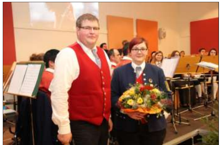
Mit Blumen bedankte sich der Obmann bei der Kapellmeisterin nach dem erfolgreichen Konzert.