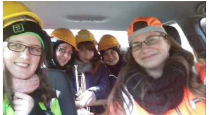
Junge „Bauarbeiterinnen“ bei der Musik-Haussammlung