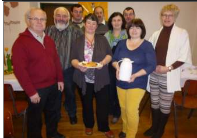
Das Arbeitsteam des Pfarrgemeinderates am 1. 2.