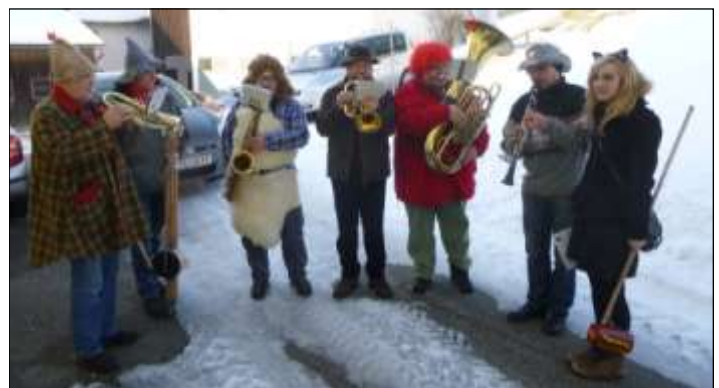
Wie man sieht, können Kopfbedeckungen durchaus unterschiedlich sein.