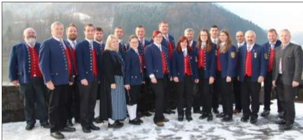
Christian Leitner fotografierte die Mitglieder des Musikvorstandes nach erfolgter Wahl vor dem GH Ettliger.