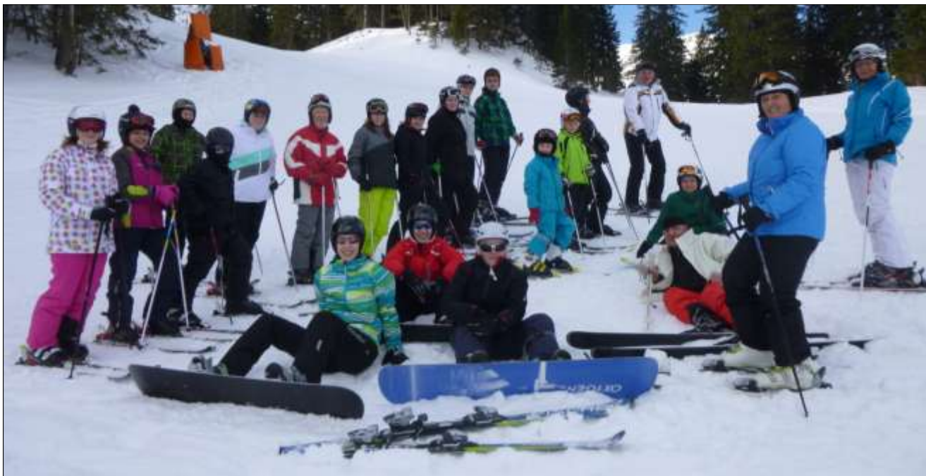
Das Foto zeigt einen Teil der Nikolaer Ski- und Snowboardfahrer am Beginn des Festes.

und der Marktgemeinde St. Nikola für den Transportkostenzuschuss.