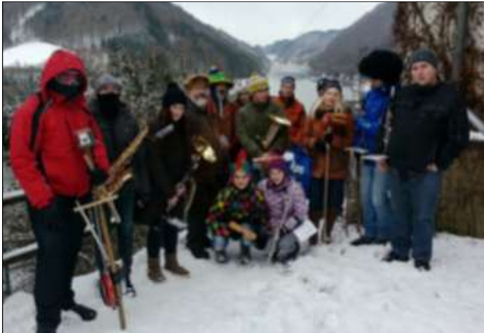
Relativ kalt war es beim Sammeln in Sarmingstein und Hirschenau.

An den letzten beiden Faschingswochenenden waren die Musiker/innen der Trachtenmusikkapelle von Haus zur Haus unterwegs. Bei der Haussammlung erhielten alle Haushalte eine eigene Zeitung des Musikvereines.