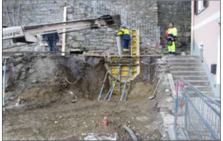
Objekt Sarmingstein 6 (Fasching) Zubau

Bereits am 9. Jänner begannen die Mitarbeiter der Firma Habau wieder mit den Arbeiten für die Hochwasserschutzmaßnahmen. Neben den Bauarbeiten bei den ersten Objekten laufen parallel die Detailplanungen für die weiteren Häuser auf Hochtouren. Die Fotos zeigen Vorbereitungsarbeiten bei den Objekten Sarmingstein Nr. 6 bzw. Nr. 2 und Struden 15 (Seyr Lagerhalle).