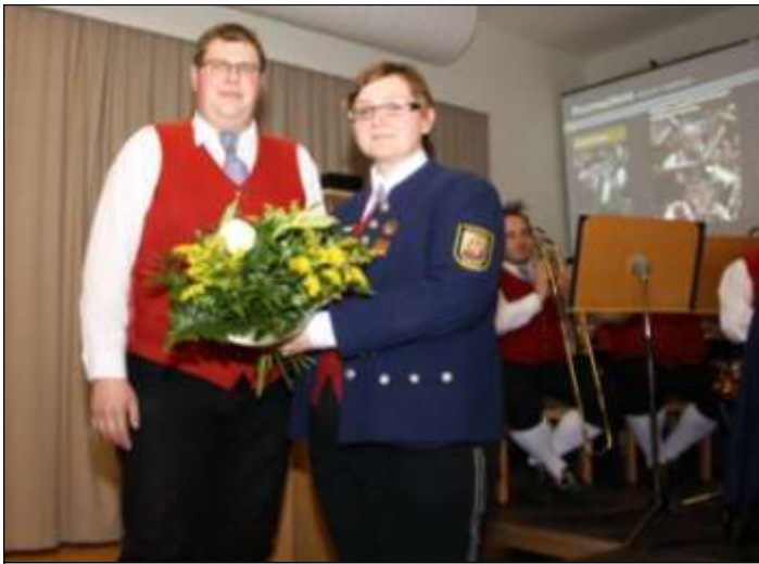
Der Obmann sagt mit Blumen „DANKE!“