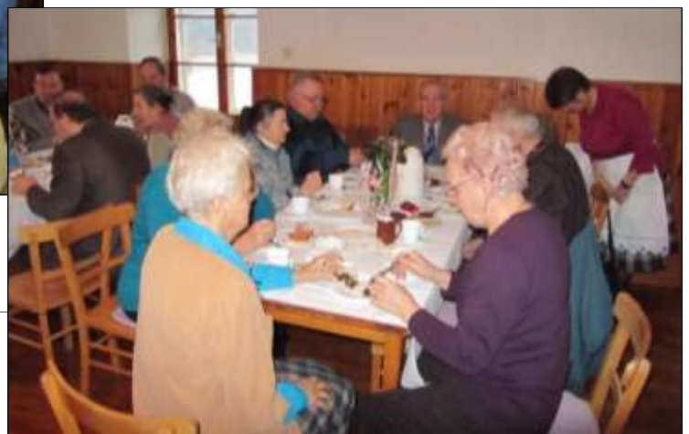
Der Pfarrcafe wurde auch von den Senioren sehr gut besucht, wie man auf dem r. Foto sieht.