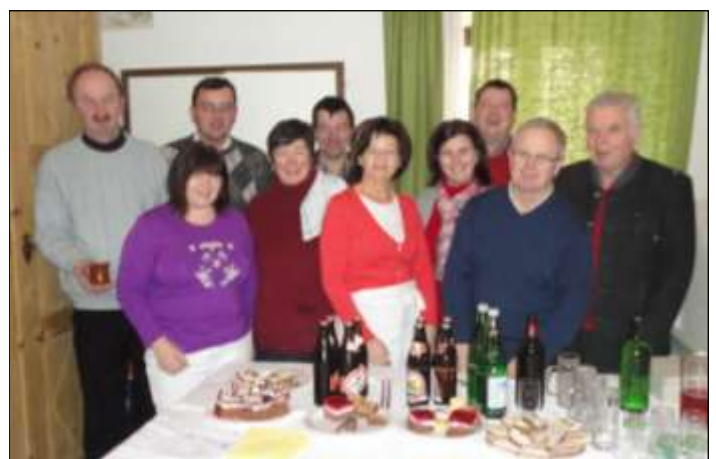
Der vom Pfarrgemeinderat veranstaltete Pfarrcafe wurde gut besucht. Ein herzliches Danke an die freiwilligen Helfer.