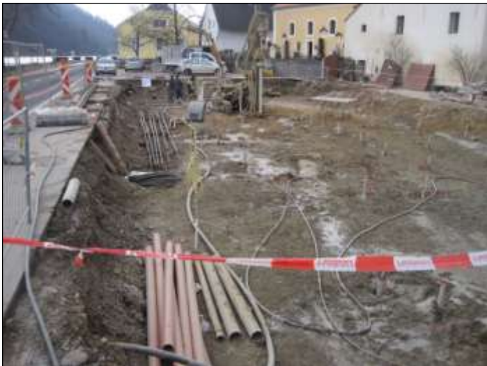
Objekt Sarmingstein 2 (Keszeg) Neubau