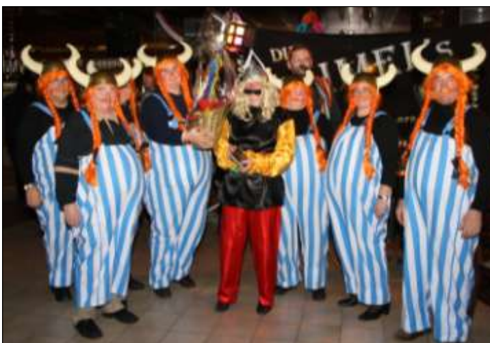
In der Geschichte bereiteten die Gallier den Römern viele Sorgen, beim Maskenball sorgten sie für gute Stimmung.