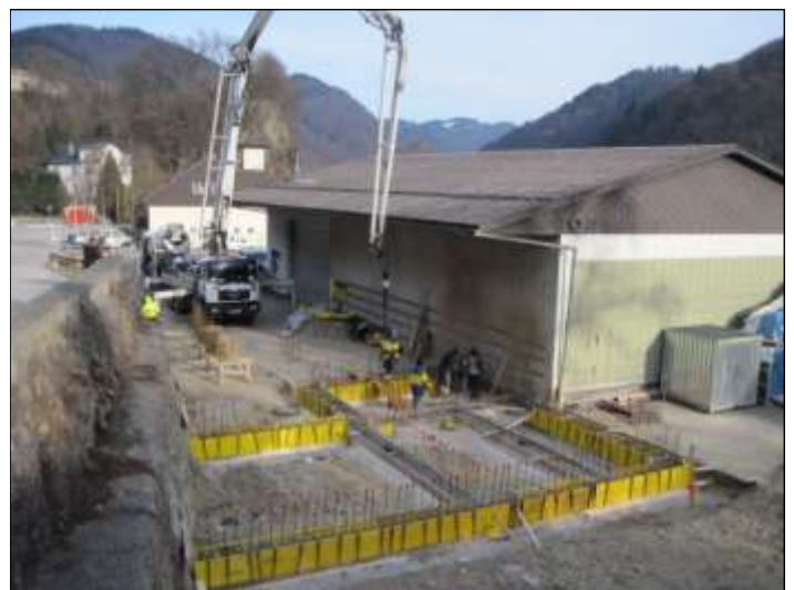
Objekt Struden 15 (Lagerhalle Seyr) Zubau