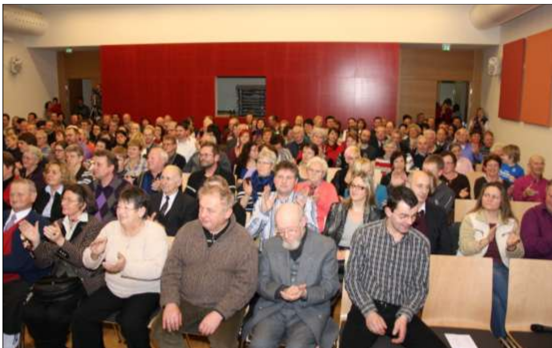
Blick in den voll besetzten Veranstaltungssaal